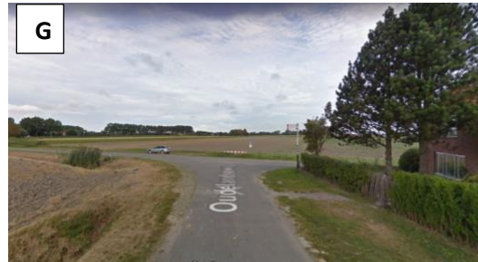
Houd links aan...