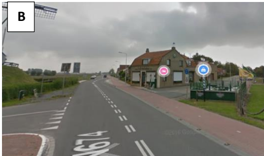
Ga rechts af...