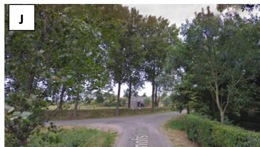
Houd rechts aan... Zie vraag 7 .