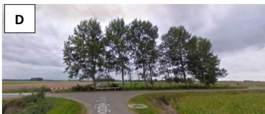
Sla rechts af...