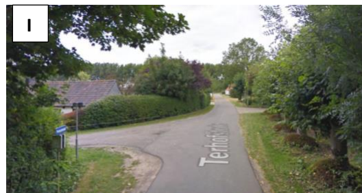
Vervolg je weg...