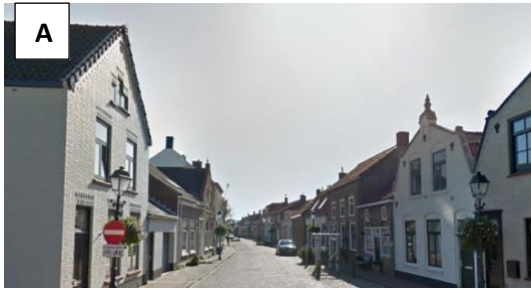
Volg deze straat tot aan de molen... Zie vraag 1 .