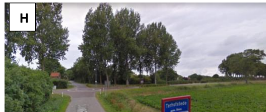
Steek dit kruispunt over... Zie vraag 6 .