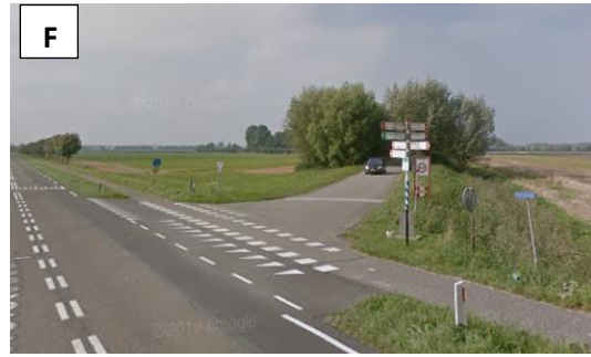
Ga rechts af en volg deze polderweg... Zie vraag 4 en 5 .