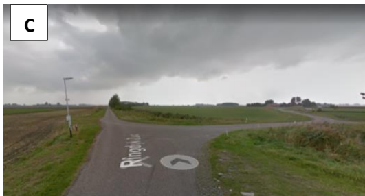
Vervolg deze weg... Zie vraag 2 .